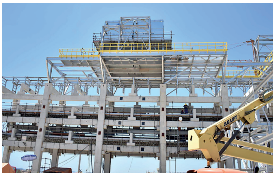
Montagem do air cooler

estão o contrato das subestações, da estrutura de apoio das tubulações ( pipe rack, tubovias ), da central de utilidades, dos prédios administrativos e da linha de transmissão.