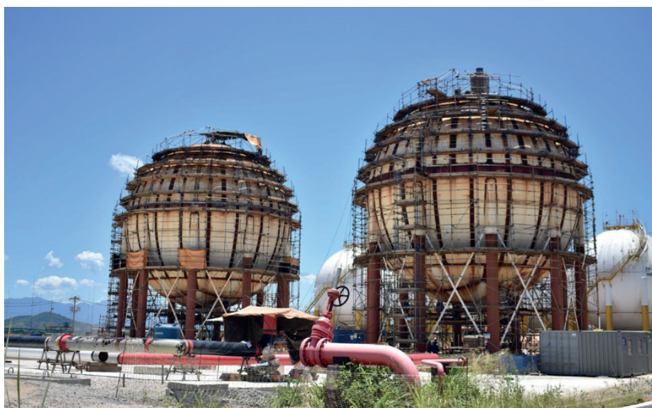
Esferas de armazenamento de gás natural

Ao todo, serão 12 contratos principais para as obras das Utilidades da UPGN. Entre eles