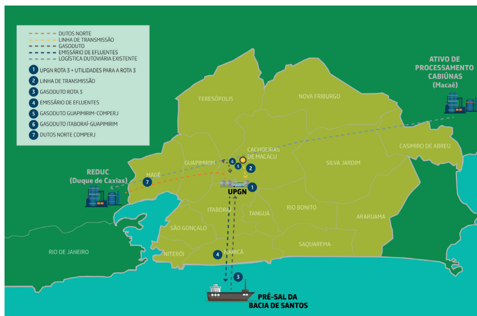
Caminho do gás natural até o Comperj