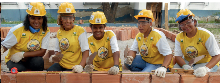
Projeto Mão na Massa: 420 mulheres capacitadas em 2019