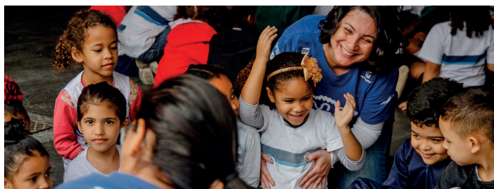
Voluntários do Meros do Brasil vão às escolas municipais

Além dos projetos, também estimulamos diálogos e ouvimos quem mais entende das necessidades locais: os moradores. Disponibilizamos um canal de atendimento, fizemos visitas, montamos grupos de escuta e participamos do Fórum da Agenda 21 Itaboraí. Nossos colaboradores foram à Escola Municipal Geremias, em Itaboraí, para falar de suas áreas de atuação e de qualificação profissional para 60 adolescentes. E para fechar com chave de ouro o ano, arrecadamos brinquedos e os doamos para a comunidade.