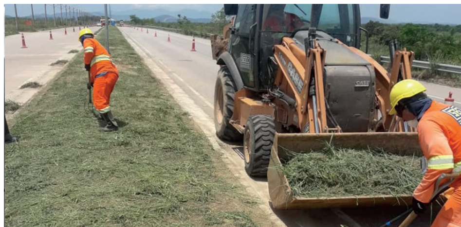
Trabalho de preservação do Comperj, com roçada dos canteiros

algumas unidades do Comperj para a produção de lubrificantes básicos e combustíveis de alta qualidade a partir de produtos intermediários da Reduc enviados para processamento no Comperj, por meio de dutos. O estudo ainda inclui a possibilidade de construção de uma termelétrica, em parceria com outros investidores, usando gás natural do pré-sal. Está mantida a implantação do Projeto Integrado Rota 3.